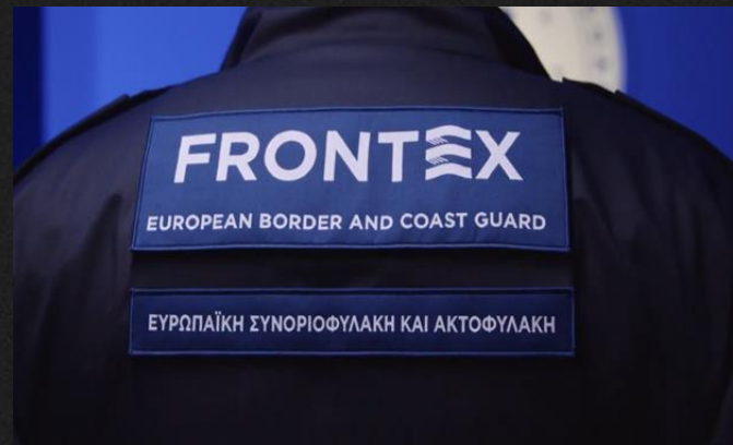
Slika 6: Uniforma Frontex stražarja