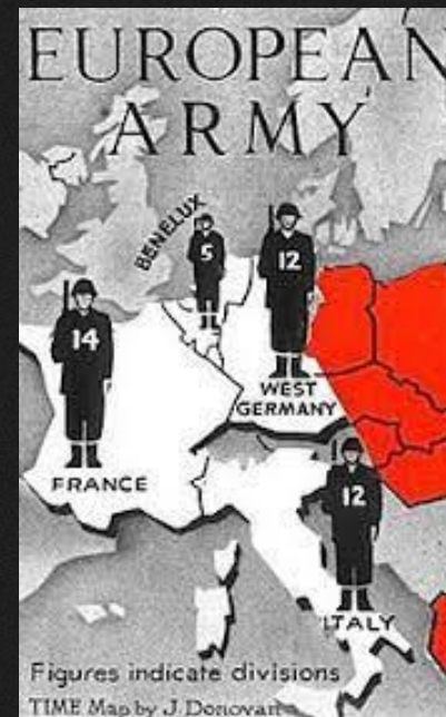
Slika 3: Predvidena Evropska obrambna skupnost