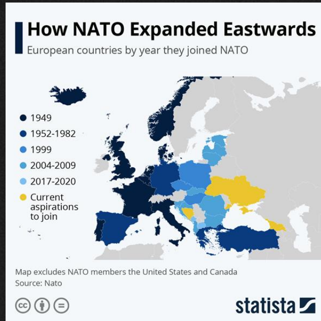
Slika 2: Širitev NATA