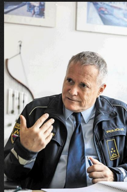
Slika 5: Marko Gašperlin, predsednik upravnega odbora Frontexa